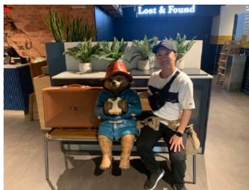
観光でパディントンカフェ